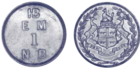
Exemples d'anciennes pièces de monnaie canadiennes. Collection nationale des monnaies, Banque du Canada; Photographie : James Zagon, Ottawa.