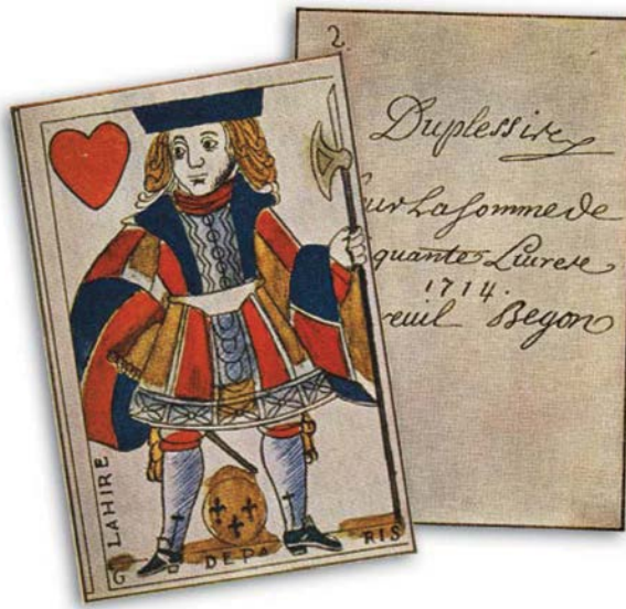
50 livres, Argent en carte à jouer du Régime français – Reproduction, 1714, Canada.

En résumé, l'argent est un « moyen d'échange » (nous l'utilisons pour dépenser), une « réserve de valeur » (nous l'utilisons pour épargner et investir) et une « unité de compte » (il nous permet de fixer tous les prix en termes d'argent).