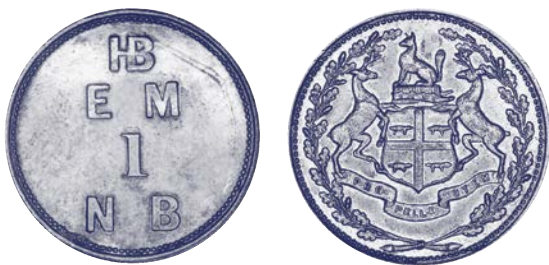
Exemples d'anciennes pièces de monnaie canadiennes. Collection nationale des monnaies, Banque du Canada; Photographie : James Zagon, Ottawa.